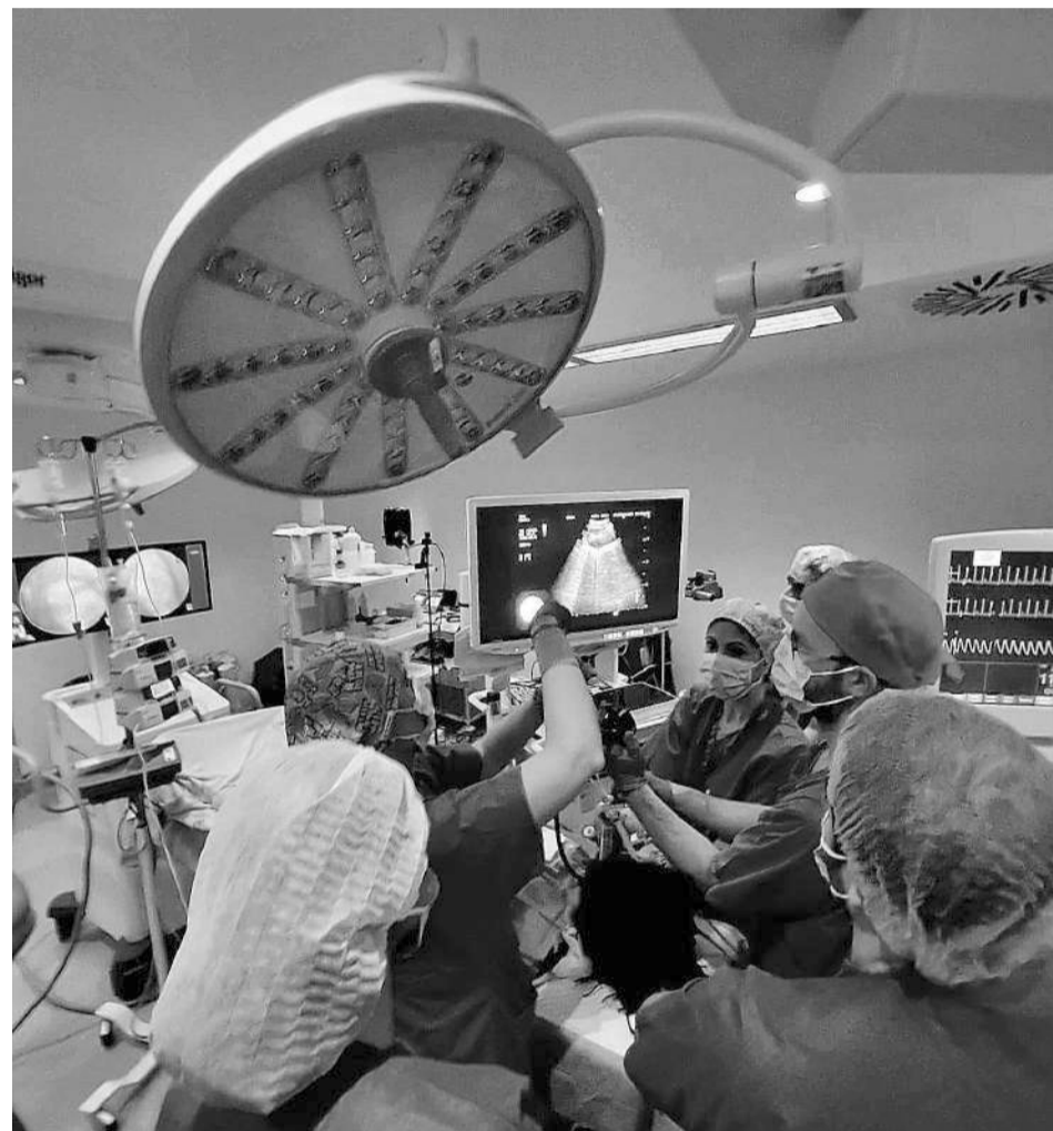
Profesionales del servicio de Neumología de Torrecárdenas durante un curso.

Explica además que las plazas se agotaron en pocos días, lo que confirma el interés por una cita que, según señala, "sitúa a Almería y a Torrecárdenas en el mapa científico". Las jornadas ponen el foco en algunas de las principales patologías y líneas de investigación ac-