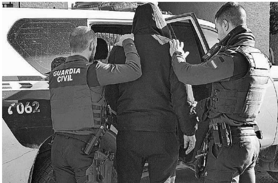
Momento de la detención del sospechoso por parte de la Guardia Civil.

En el transcurso de las gestiones de investigación practicadas se logró la identificación del pre-