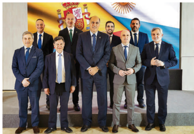
El embajador junto al presidente de Diputación.

El presidente de la Diputación de Almería, José Antonio García Alcaina, ha recibido en el Palacio Provincial al embajador de Argentina en España, Wenceslao Bunge. Ambos han mantenido una reunión de trabajo con el objetivo de estrechar la