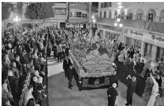
Semana Santa de Huércal-Overa.

La Semana Santa de Huércal-Overa, declarada de Interés Turístico Nacional, continúa consolidándose como un referente internacional gracias a la retransmisión en directo a través de Internet. En esta edición, el seguimiento de los