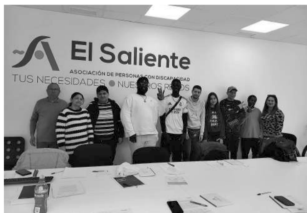
El Saliente y La Caixa colaboran en esta iniciativa.

La Asociación El Saliente, en colaboración con la Fundación "la Caixa", ha puesto en marcha una acción formativa dirigida a personas en situación de vulnerabilidad, con el objetivo de acompañarlas en su camino hacia el empleo y la mejora de