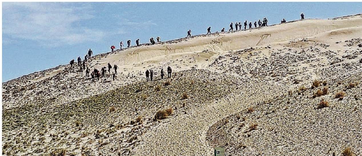
Imagen del del grupo de turistas subiendo a la duna de Mónsul.

Carteles En el cartel instalado por la Consejería de Sostenibilidad, Medio Ambiente y Economía Azul de la Junta de Andalucía se plasma que "las acciones que atenten contra la configuración geológica de los terrenos se consideran sanción grave con multas desde los 601,02 hasta los 60.101, 21 euros", según la Ley 2/1989 por la que se aprueba el Inventario de Espacios Naturales Protegidos de la Comunidad de Andalucía y se establecen