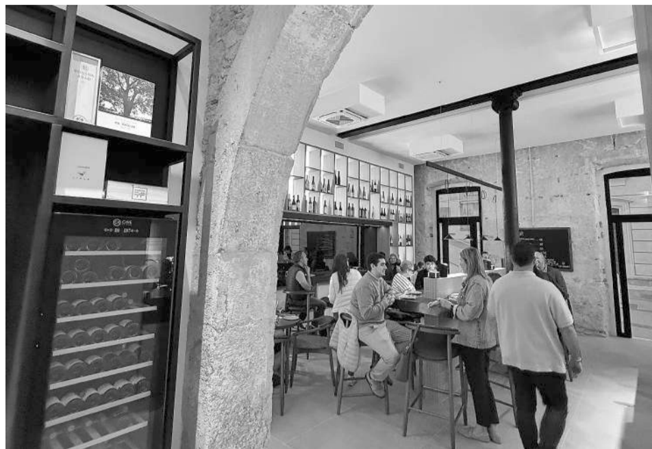
Nuevo restaurante La Higuera, en la calle Juan Leal de Almería.

Se trata de un local de 400 metros que antes ocupaba