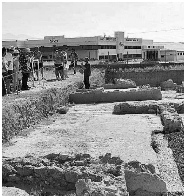
Visita a Ciavieja en una imagen de archivo.

Objetivo El objetivo que se persigue con esta nueva iniciativa es el de ampliar la