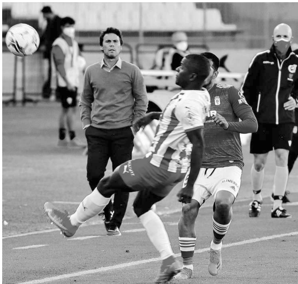
El día que Rubi debutó en el Almería: 1 de mayo de 2021 ante el Oviedo, (2-2).

Así las cosas, de los 175 partidos el balance general contempla: 81 victorias, 39 empates y 55 derrotas. Recordar que Rubi debutó un 1 de mayo de 2021 en un Almería (2-2) Oviedo en el Estadio de los Juegos Mediterráneos. Aquel Rubi, cinco años más joven, llegó, luego se fue tras cumplir los objetivos y volvió para intentar llevar de nuevo al Almería