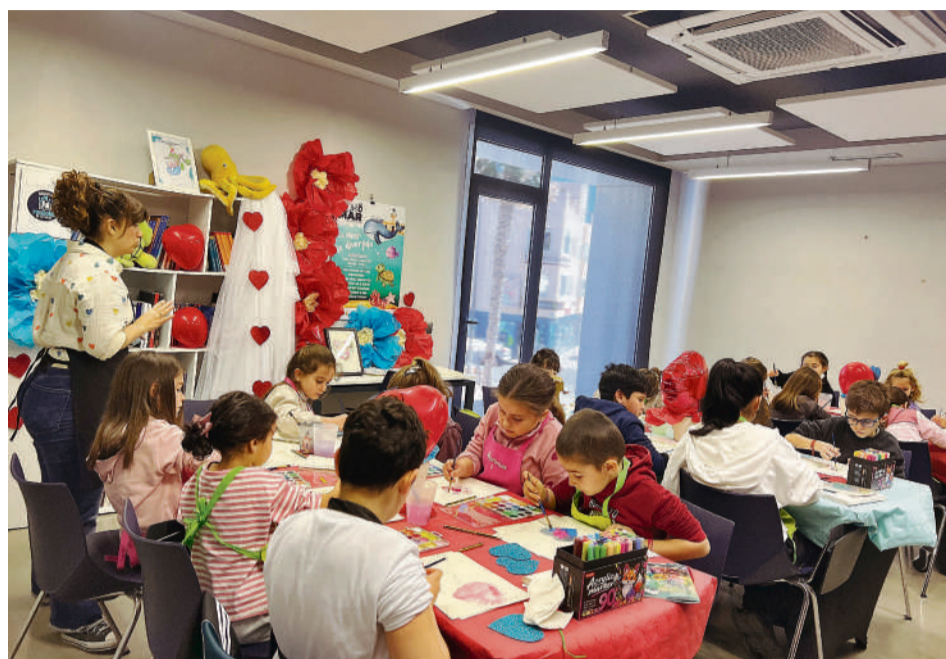
Archivo de un taller de 'La Mar Divertida'.