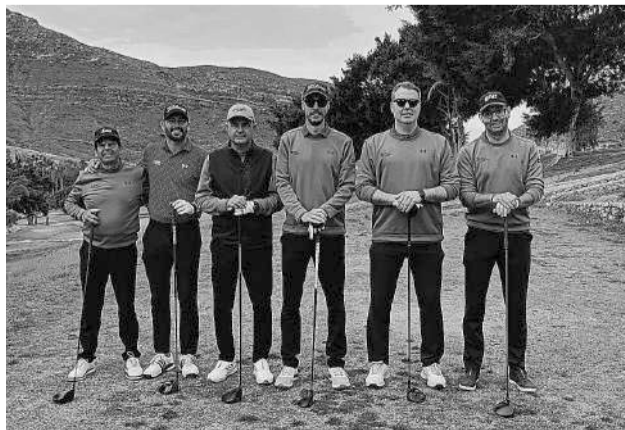
La Liga de Golf Almeriense sigue creciendo. LA VOZ

La décima y última jornada de la Liga Regular de Golf Almeriense puso el broche a una fase inicial marcada por la igualdad y la emoción hasta el final. Los resultados han terminado de definir la clasificación y el camino hacia el título en las próximas semanas. En