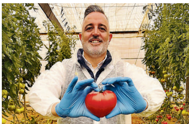
Amortoma, tomate de forma acorazonada. LA VOZ

En un sector donde la diferenciación marca el ritmo, la innovación también se cultiva. Yuksel Seeds refuerza su apuesta por el desarrollo de nuevas variedades con el lanzamiento de Amortoma, un tomate tipo corazón de