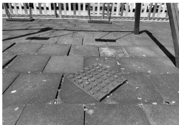
Baldosas sueltas en el parque infantil. LA VOZ

Astillamientos en maderas, riesgo de atrapamiento de dedos, losetas sueltas, suelos que no cumplen con la amortiguación, óxido en piezas metálicas, cadenas que no cumplen normativa, partes rotas, etc. son algunas de las deficiencias que,