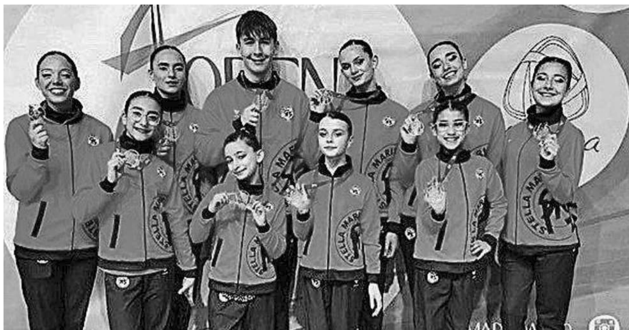
EL DEPORTE ALMERIENSE vuelve a demostrar su excelente estado de forma, esta vez de la mano de la gimnasia acrobática. El Club Stella Maris ha firmado una actuación sobresaliente.