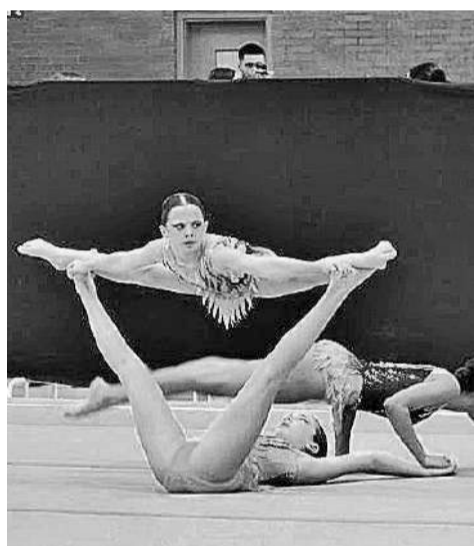
LA GIMNASIA ACROBÁTICA exige un nivel de sacrificio altísimo.