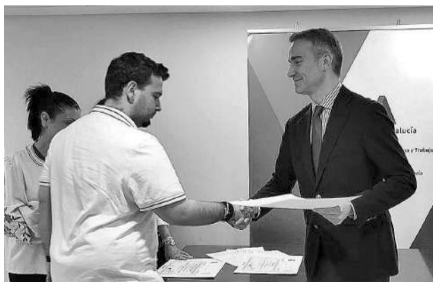
El delegado de Empleo entregando ayudas.

Las empresas de inserción y las empresas del mercado ordinario de Almería pueden solicitar hasta el 20 de abril ayudas destinadas a la inserción laboral de personas en riesgo o situación de exclusión social dentro de la convocatoria andaluza