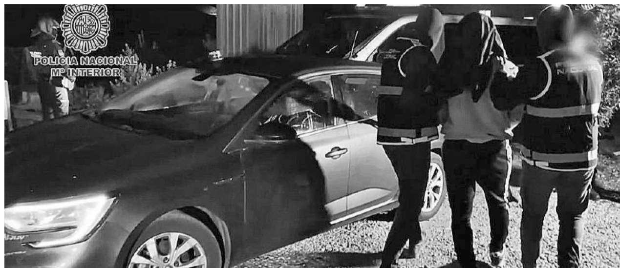
Imagen de archivo de la detención de un hombre por presunto yihadismo en Almería.

Su acceso a la academia no fue directo. Ha-