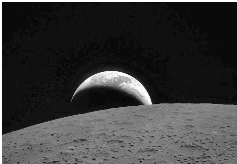
Imagen de la superficie de la cara oculta de la Luna.

Por su parte, la agencia espacial estadounidense ha colgado en su perfil una