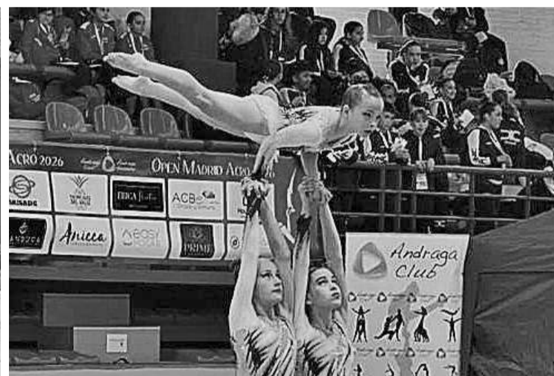
EL STELLA MARIS sigue así consolidándose como una referencia en la gimnasia acrobática, llevando el nombre de Almería a lo más alto.