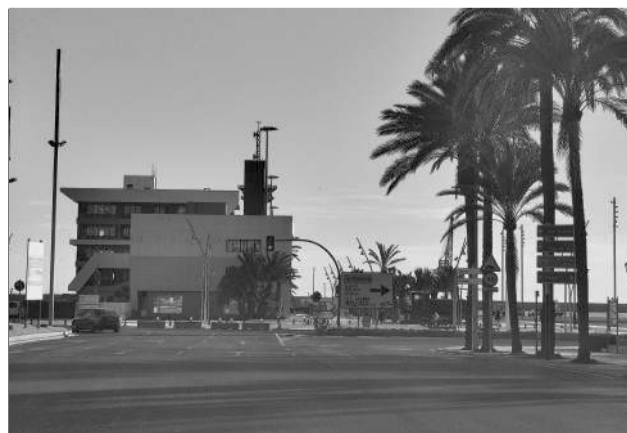
Conexión con el Puerto de Almería