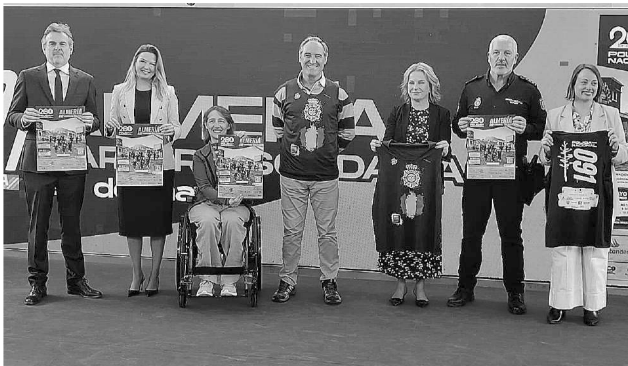
Acto de presentación de la carrera Ruta 091 en el Centro Comercial Torrecárdenas.

La cita será el 24 de mayo a las 10:30 horas, con salida y meta en el entorno