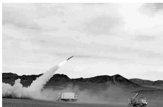
Uno de los misiles disparados por Irán.

La Guardia Revolucionaria de Irán ha amenazado con “privar a Estados Unidos y sus aliados” de “gas y petróleo” durante “años” en caso de que Washington “cruce las líneas rojas” de Teherán, en medio de la ofensiva lanzada el 28 de