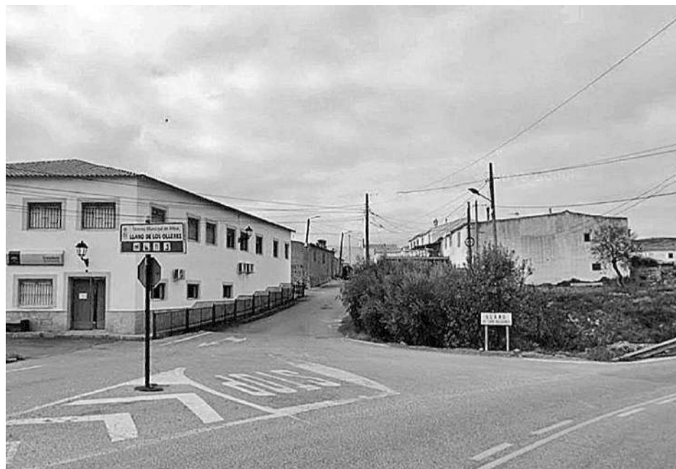
Cruce de acceso a la pedanía que será sustituido por una rotonda.