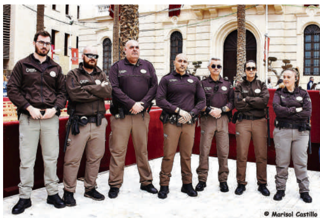
Trabajadores de Grupo Control durante la Semana Santa.

El buen tiempo registrado durante estos días