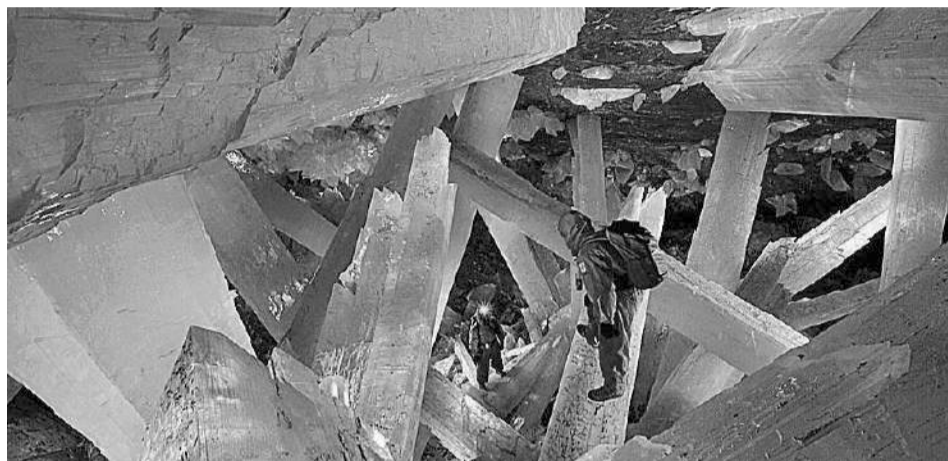
Geoda de Pulpí.

Un equipo internacional de investigación con participación de la Universidad de Almería (UAL), la Universidad de Bolonia (Italia), la Universidad de Bergen (Noruega) y la Academia China de Ciencia (China) ha demostrado que los grandes cristales de yeso de cuevas como la geoda de Pulpí en Almería o la cueva de Naica en México sirven como 'archivos naturales' para reconstruir el clima del pasado. A través del análisis del agua atrapada en su interior y la edad de los cristales, los expertos han obtenido información sobre cómo eran las lluvias y las condiciones