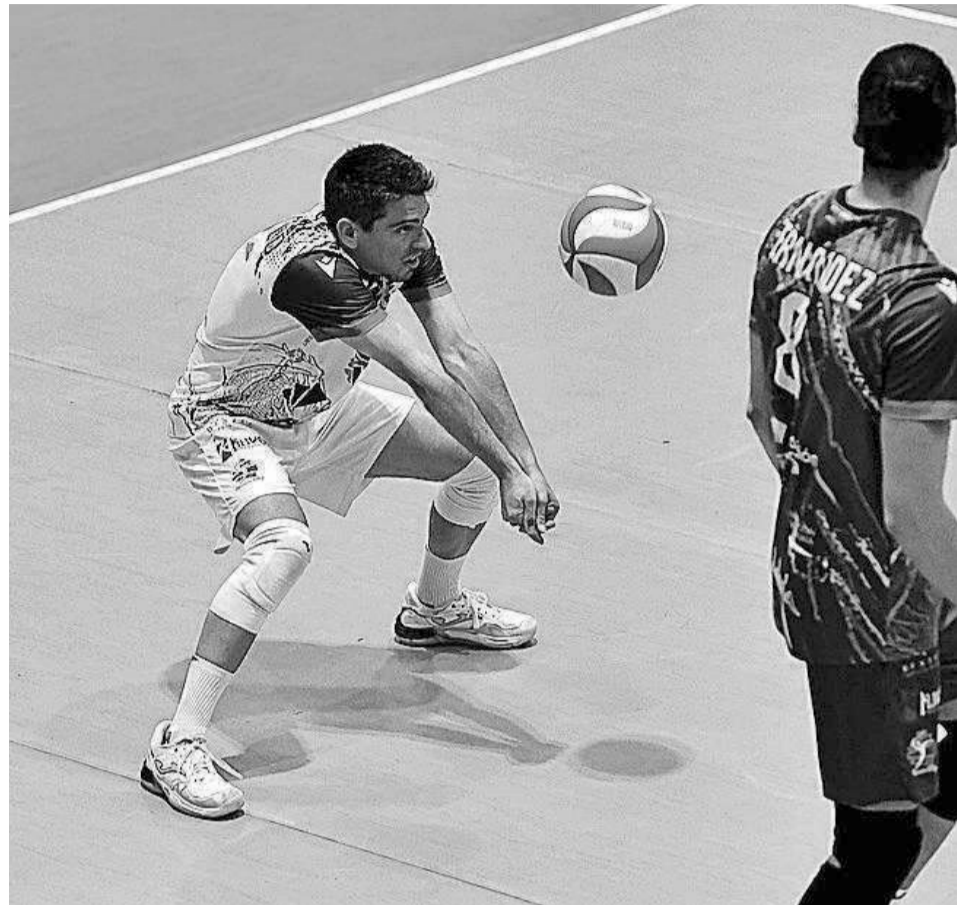
Paquillo es uno de los grandes referentes de Unicaja Costa de Almería.

No hay presión en el lado verde y se puede dar la sorpresa, "claro que sí", sabiendo además que "estamos delante de un club que yo creo que si lo eliminamos puede ser un gran fracaso para ello". Sin embargo, "para nosotros pasar de ronda después de la temporada que llevamos sería una gran victoria". Por eso, punto a punto, set a set y partido a partido, "y lo que vaya viniendo, bienvenido sea, y si pasamos, más que un logro". Factor cancha en contra... o no tanto: "La verdad es que nos da mucho juego empezar en casa, porque si nos vamos con una victoria de aquí para Canarias, la cosa cambia". Si eso fuese así,