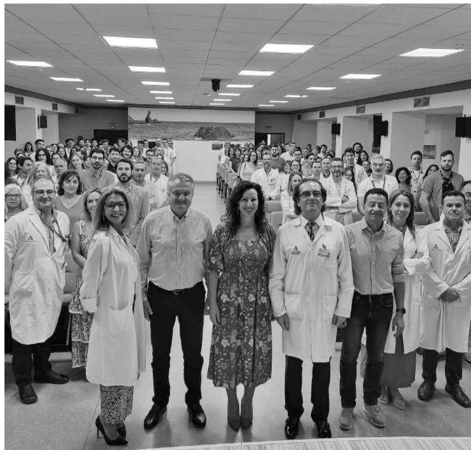
Acto con médicos residentes en el Hospital Universitario Torrecárdenas.

De los datos expuestos en el Informe de Demografía Médica en Andalucía 2025 correspondientes