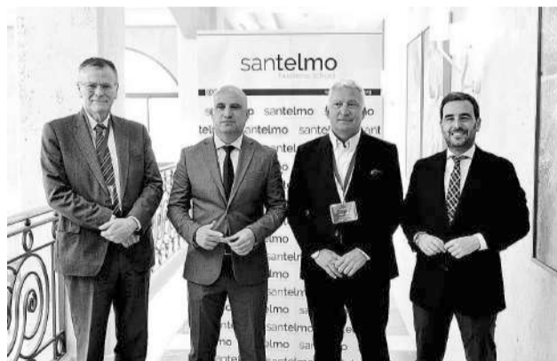
Representantes de Diputación y la Fundación.

La Diputación de Almería y la Fundación San Telmo han puesto en marcha en la provincia el Programa de Dirección de Empresas Agroalimentarias (DEA) de San Telmo Business School, dirigido a directivos, propietarios y profes-