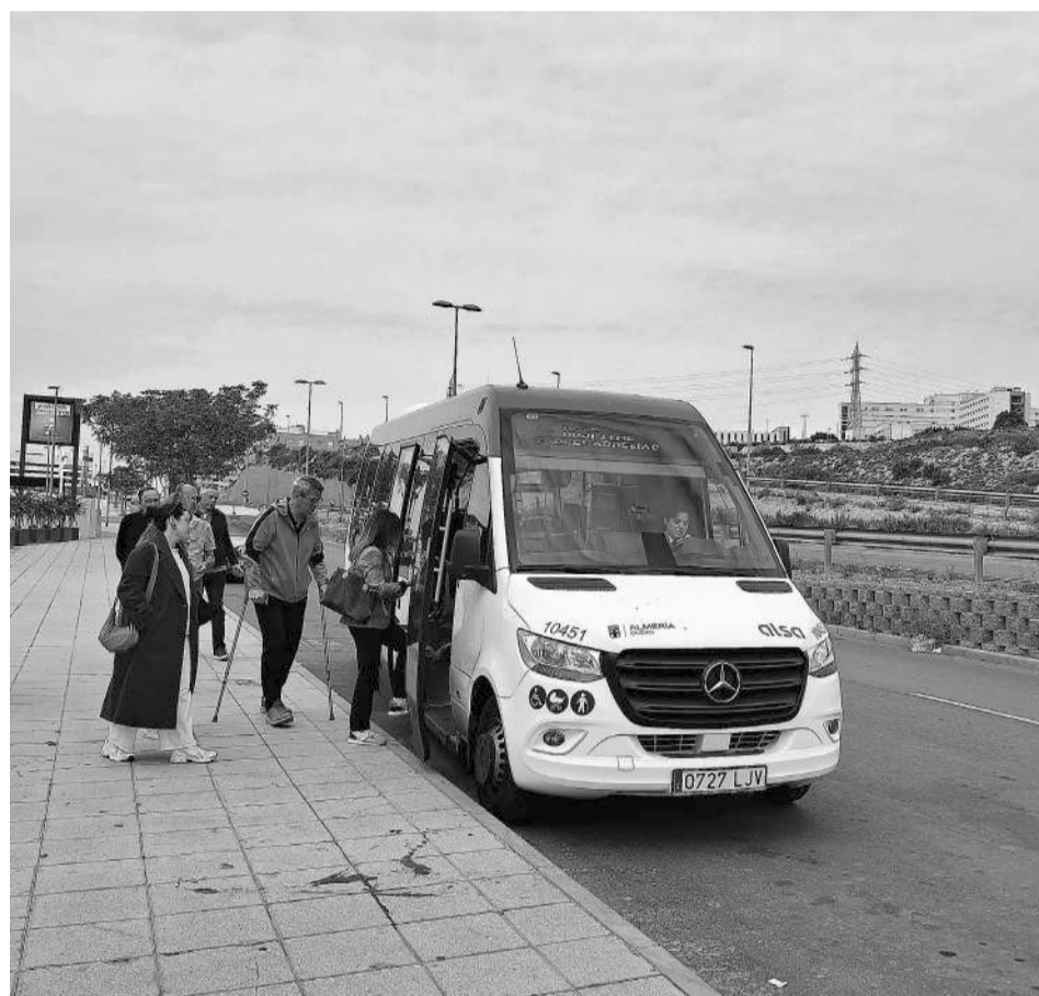
Un grupo de personas coge el bus que les llevaría hasta Torrecárdenas, ayer.

Entre las principales críticas destacan las de quienes consideran que el servicio debería prolongarse durante algún tiempo más, puesto que a su entender el horario limitado del servicio -que según dicen no cubre completamente los turnos del personal sanitario-. Otros lamentan la ausencia de alternativas en horario de tarde y noche, y las dificultades