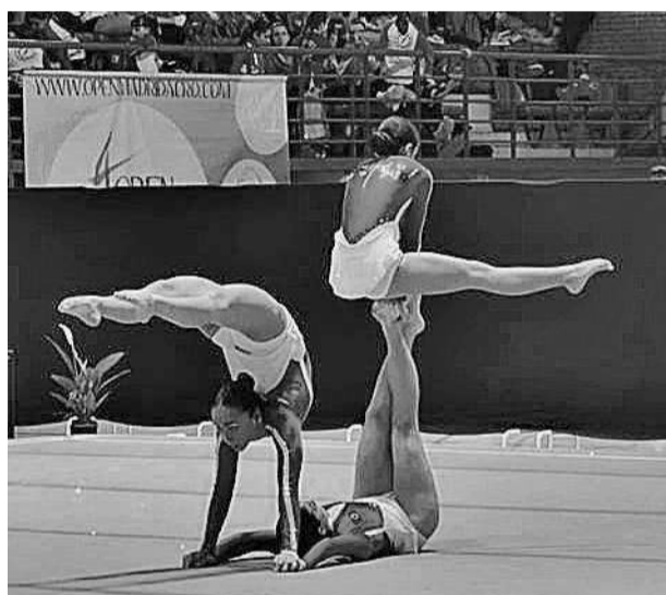
DETRÁS DE CADA MEDALLA hay mucho más que una actuación de apenas unos minutos.