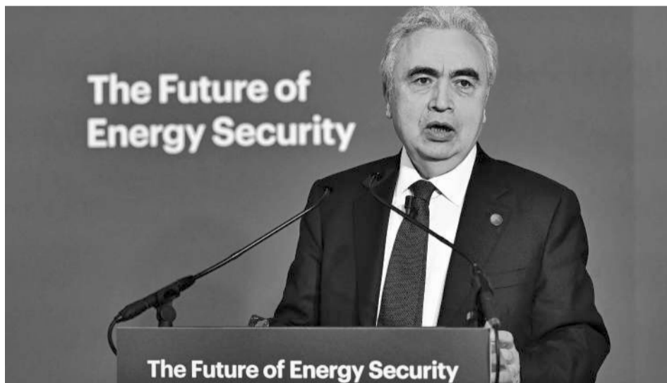
Fatih Birol, director ejecutivo de la Agencia Internacional de la Energía (AIE).

El directivo turco de la AIE ha admitido ser “muy pesimista” respecto de la