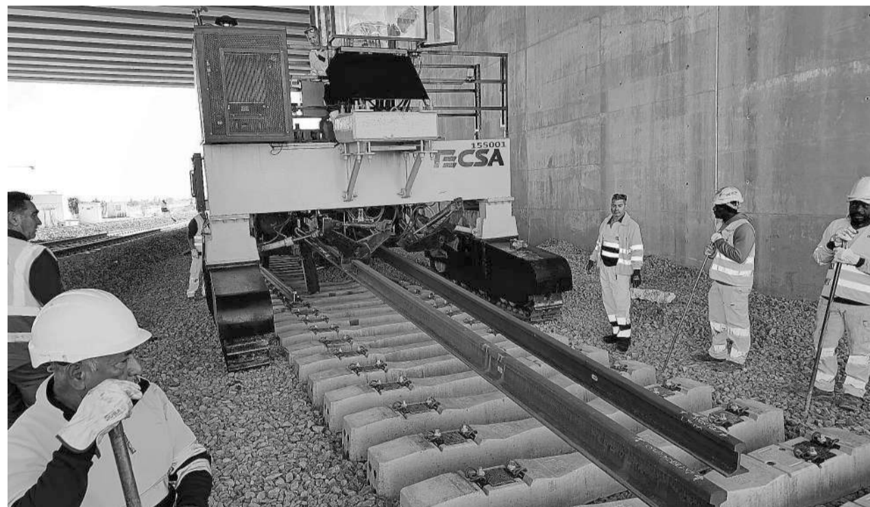
Los primeros trabajos de montaje de vía en la plataforma hasta Almería han comenzado en Murcia. LA VOZ

Las fechas Durante una entrevista en la Cadena SER Levante, el presidente de la institución empresarial que sigue al centímetro los trabajos como parte de la plataforma ‘Quiero Corredor’ se ha desmarcado, al menos de momento, de los vaticinios pesimistas. “Con lo que tenemos ahora mismo encima de la mesa, con lo que yo ahora mismo veo y palpo, el AVE podría estar