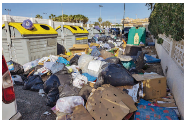
Contenedores en La Urbanización.

Ante el reciente anuncio de la plantilla de trabajadores de la empresa concesionaria de limpieza en Roquetas de Mar, de una posible huelga este verano si no recibían los pagos que se deben a algunos empleados desde 2024, el