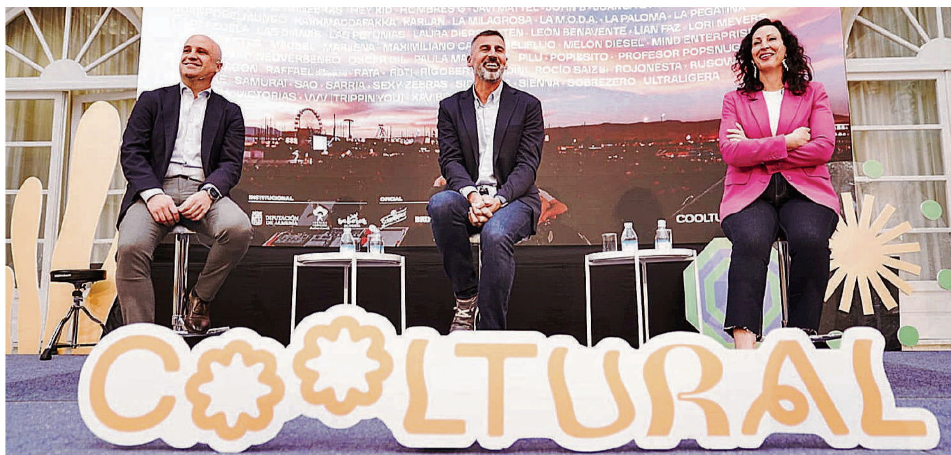
Presentación en el Patio de Luces de la Diputación Provincial, en la tarde de ayer, de la edición 2026 de Cooltural Fest. LA VOZ