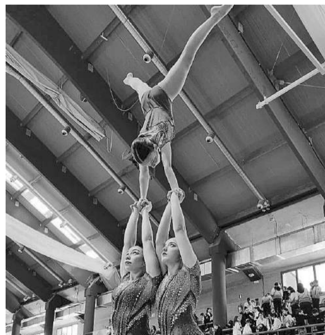
LA COMPETICIÓN volvió a poner de manifiesto la espectacularidad de esta fantástica disciplina.