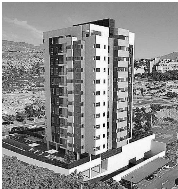
El residencial es como una espiga en una sabana.

realizar una segregación del conocido, urbanísticamente, sector San Rosendo o Arcos, quedando disuelto el condominio y dando como resultado la apertura del actual Lidl, y el proyecto de otra torre que no llegó a encauzarse. Se trataba de Torre Indalo, proyectada aún más alta que San Rosendo, con 14 plantas, promovida por la estafadora promotora Grupo 21, que se quedó con más de 30 millones de dinero en señal y entra-